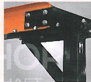
Stabile Bauweise der Trägerstützen